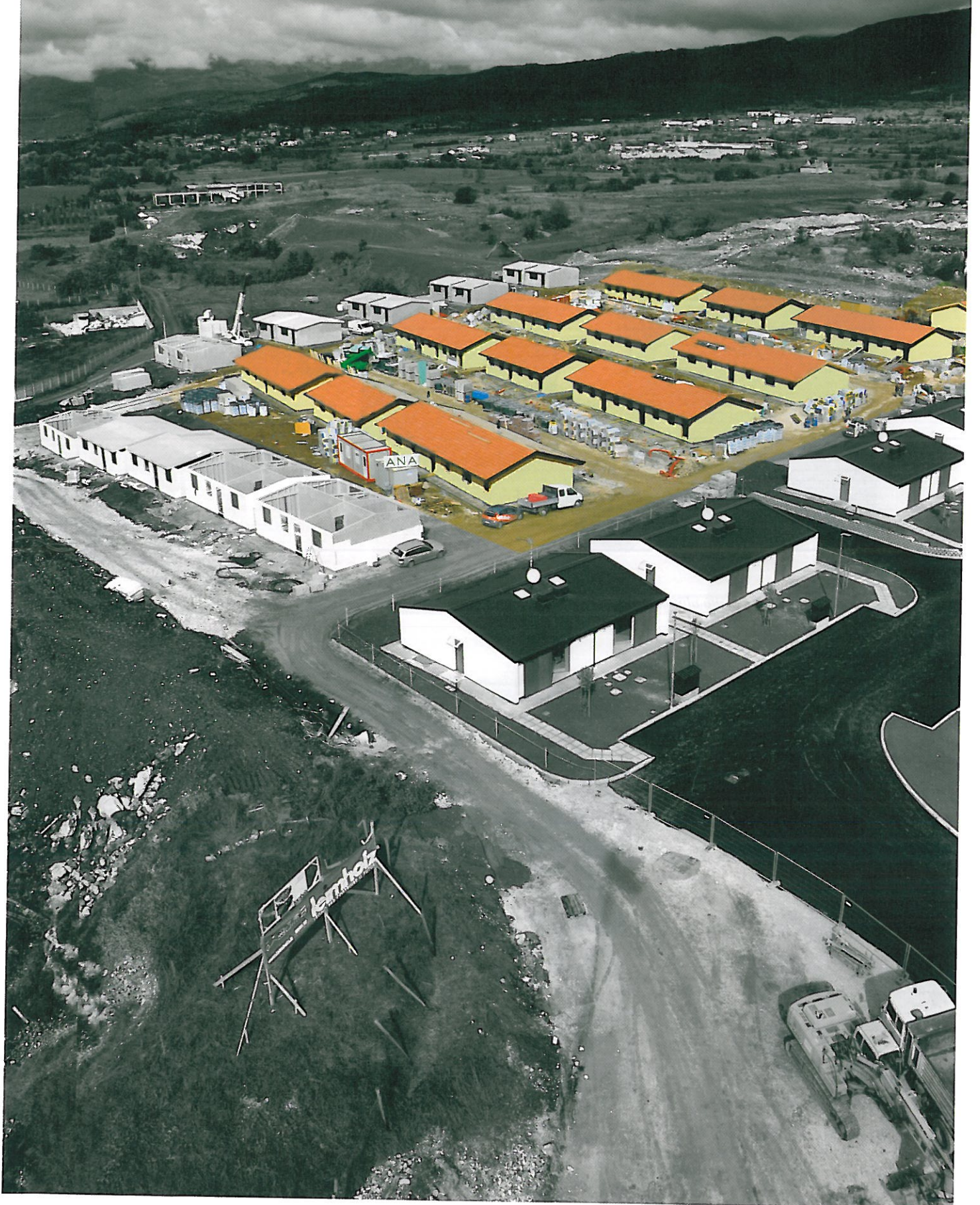
Villaggio Alpino di Fossa (Aq)